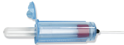
Porte-tubes de recueil de sang VanishPoint®